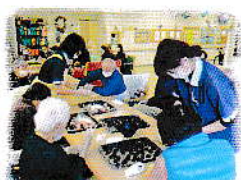
チャレンジ料理教室

「心と体の健康を保ち、今までと変わらない生活を送りたい」そんな皆様の思いに応えるべく、みんなで、お友達と、独りでもお楽しみいただけるプログラムを開発、ご提供いたします。