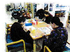
玩具・プリントプログラム