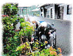
チャレンジ園芸活動【季節限定】